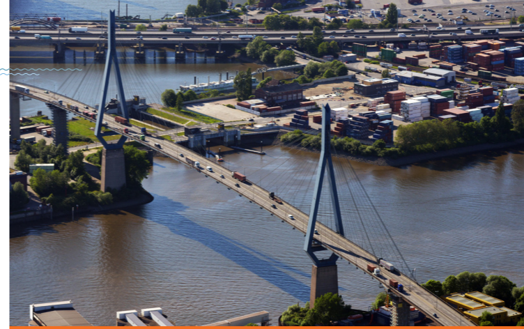
Köhlbrandbrücke, © Hamburg Port Authority (HPA)/Martin Elsen

Diese Veranstaltung wird als Präsenzveranstaltung geplant und unterliegt den aktuellen und perspektivischen Einflüssen der Corona-Pandemie. Unter Berücksichtigung der weiteren allgemeinen Entwicklung, behördlicher Auflagen bzw. Auflagen der Veranstalter können sich inhaltliche Veränderungen oder eine kurzfristige Absage ergeben.